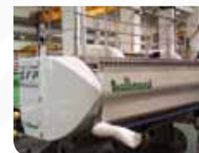
Industrie Capotage de machines