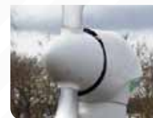
Concept clé en main Capot moteur d'éolienne