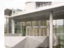
Bâtiment Habillage des poteaux Tour CB3 Paris la Défense