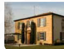
Fabrication de volets isolants www.polyhabitat.fr